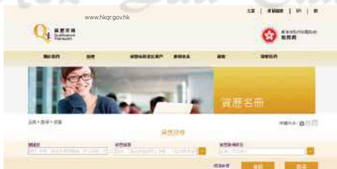
同學可於資歷名冊搜尋已通過評審的課程資料, 包括其資歷級別、類別、營辦者及登記狀況等。