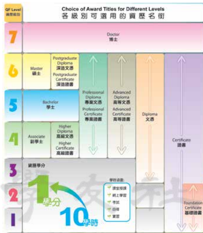
「資歷名冊計劃」規範了培訓機構頒授資歷架構認可的資歷和開辦相關課程時可使用的資歷名銜, 同學可藉此更容易了解課程所屬的資歷級別。